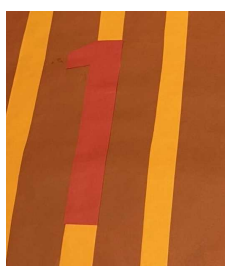
柄と番号が同化している