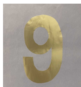
銀色で光って見えづらい