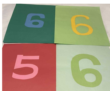
地の色と対照的ではない