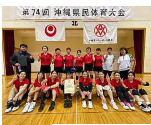
令和4年度県民体育大会